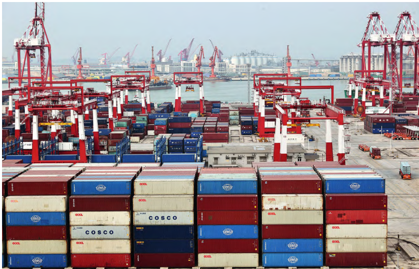
被称为“湾区之心”的广州南沙走在开放前沿。图为2023年11月7日拍摄的广州港南沙港区。

着力推进大湾区科技要素市场一体化。珠三角的制造业领域开放时间较早，开放范围较广、程度较高，已经成为全球重要货物贸易基地。相比较而言，金融、法律、教育、咨询、医疗等领域服务业开放则较为滞后。建议在全国统一大市场的框架下，立足粤港澳大湾区已有的产业基础和科技优势，以香港与深圳深化合作