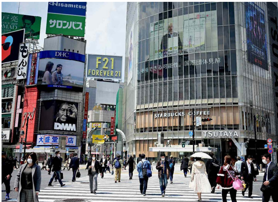
▲ 新冠肺炎疫情对全球消费需求、供应链、经济秩序造成冲击

应进一步强化对民营企业针对性扶持政策的支持效果、政策组合的协调性与执行力。通过此次疫情，政府各部门应开始重视梳理分析应对突发事件效果显著的有效政策，按照短期、中长期等期限和财政、金融等类型以及所属政府部门等进行分类打包，建立救助帮扶民营企业应对突发公共事件基础综合政策组合包数据库。同时，由于中央政府和地方政府先后出台了多项扶持政策，其中部分政策存在重复、交叉，部分政策