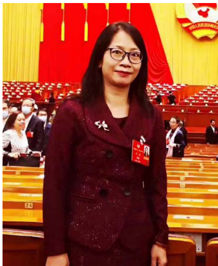
▲ 全国政协委员钟瑛在政协全委会会场

零售、娱乐等人群聚集性行业的需求产生了直接冲击，从而造成失业率短期内急剧上升、经济出现衰退。如旅游业，受冲击最严重的除中国之外，是韩国、日本、西欧和北美旅游市场。据牛津经济研究院的估算，全球旅游业的损失预计将达 220 亿美元；交通运输业，据国际航空运输协会的估算，2020 年亚太地区航空公司或将损失 278 亿美元。